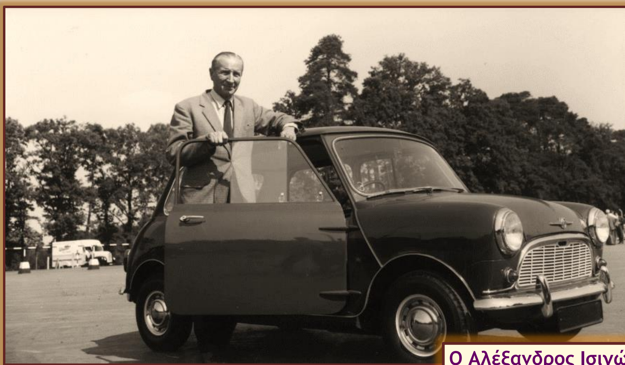
Ο Αλέξανδρος Ισιγώνης και το Mini Cooper.

Ο ελληνικής καταγωγής Βρετανός Alec Issigonis (Αλέξανδρος Ισιγώνης) ήταν ένας από τους ανθρώπους οι οποίοι έμειναν στην ιστορία της σχεδίασης αυτοκινήτου και πιο συγκεκριμένα του θρυλικού και γνωστού Mini Cooper. Γεννήθηκε στη Σμύρνη στις 18 Νοεμβρίου 1906. Ο πατέρας του καταγόταν από την Πάρο, ενώ η μητέρα του, Χίλντα, ήταν Γερμανίδα, κόρη πλουσίου ζυθοποιού της Σμύρνης. Κατά τη μικρασιατική καταστροφή, ο Αλέξανδρος κατάφερε να διαφύγει με τη μητέρα του στο Λονδίνο, όπου ολοκλήρωσε και τις σπουδές του. Μετά την αποφοίτησή του, ξεκίνησε η επαγγελματική του καριέρα στην αυτοκινητοβιομηχανία της Μεγάλης Βρετανίας, η οποία την εποχή εκείνη βρισκόταν σε μεγάλη ακμή.