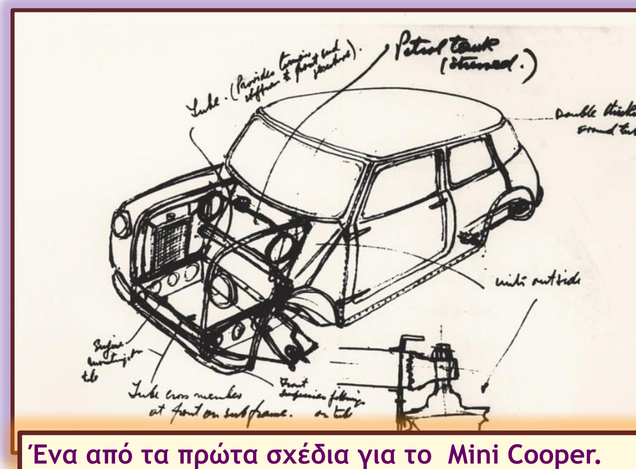
Ένα από τα πρώτα σχέδια για το Mini Cooper.

Το Mini έγινε παγκόσμιο best seller, αφού πούλησε 5,3 εκατομμύρια αυτοκίνητα σε ολόκληρο τον κόσμο (το αγγλικό αυτοκίνητο με τις περισσότερες πωλήσεις στην ιστορία) και χάρισε στον σχεδιαστή και εμπνευστή του μια θέση ανάμεσα στους Μεγάλους του 20ου αιώνα. Το «Κουπεράκι», σύμβολο της νεανικής ανεξαρτησίας των 60's, αγαπήθηκε όσο ελάχιστα αυτοκίνητα, αποκτήθηκε από όλες τις κοινωνικές τάξεις και ηλικίες και βρισκόταν στην εργοστασιακή παραγωγή μέχρι το 2000, όταν με βελτιώσεις και παραλλαγές κυκλοφόρησε ως «New Mini» από την BMW. Το χαμηλό αμάξι, η μπροστινή κίνηση, τα πλατιά λάστιχα, τα καταπληκτικά κρατήματα και το μοναδικό τιμόνι, αποτέλεσαν σημείο αναφοράς στην οδηγική συμπεριφορά και γοήτευσαν τους πάντες στα σχεδόν 50 χρόνια ύπαρξής του.