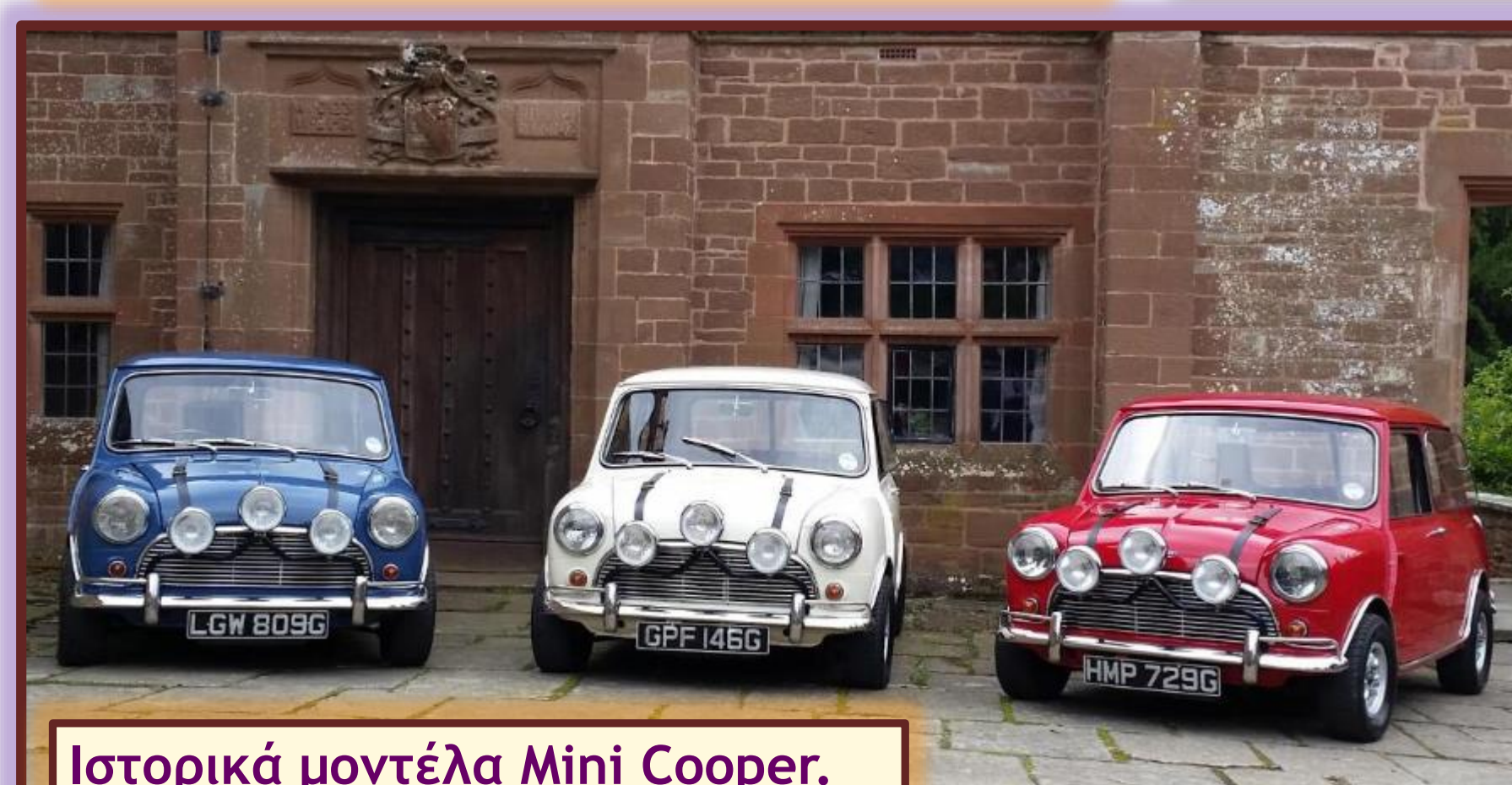
Ιστορικά μοντέλα Mini Cooper.